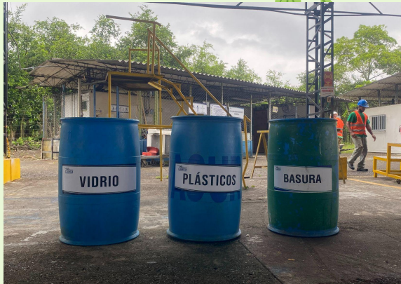
RECOLECCIÓN DE RESIDUOS