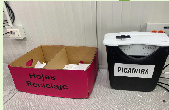
RECICLAJE DE PAPEL