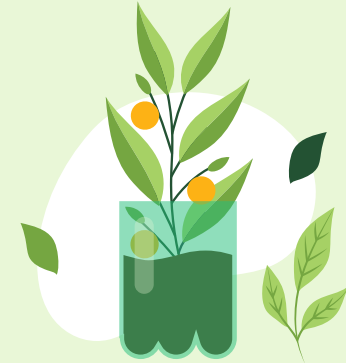
SIEMBRA DE ÁRBOLES