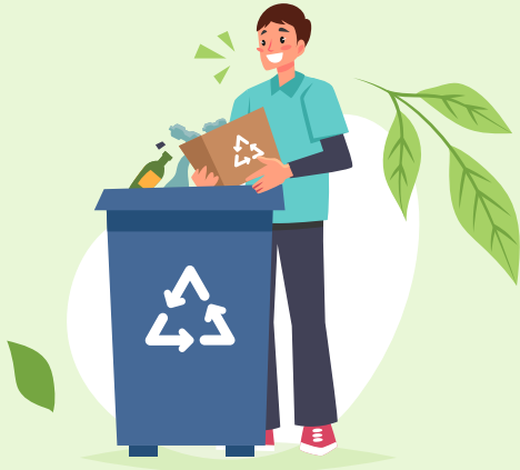
RECOLECCIÓN DE RESIDUOS