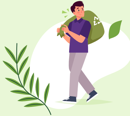
RECICLAJE DE PAPEL