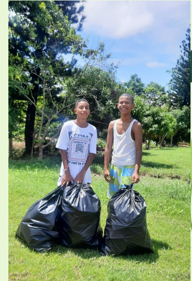
RECICLAJE URBANO O SOCIAL